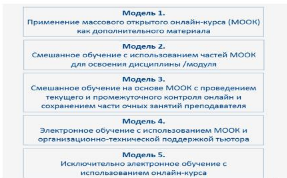
Рис. 3. Модели использования онлайн-курсов

На сегодня в системе профессионального образования реализуются несколько моделей встраивания онлайн-курсов в образовательный процесс (рис.3).