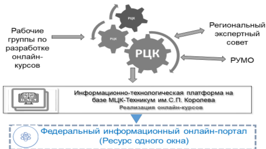
Рис.1.Процесс разработки и оценки качества онлайн-курсов

Процесс разработки и оценки качества онлайн-курсов отражен на рисунке 1.